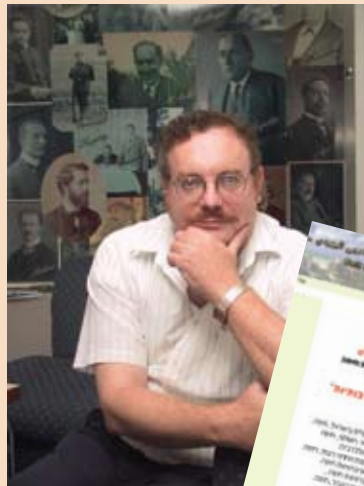
ד"ר קיום עם ערבים. ומה עם גוש קטיף?

אני קורא לכל נאמני ארץ ישראל לבוא ולהתאחד למען עמנו וערי אלוקינו תחת הדגל של ארץ ישראל לעם ישראל על פי תורת ישראל.