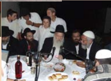
תמונות מהווי המיוחד בישיבה

"בעיקרון, הישיבה נועדה לבחורים שלא נקלטו במסגרות חרדיות. בישיבה לומדים כ-30 תלמידים. כחלק בלתי נפרד, הישיבה מחנכת ליישוב הארץ ולמסירות נפש עבור ארץ ישראל. כחלק מהמגמה, מספר הרב שנדורפי, "החזקנו את המאחז יד יאיר" ליד דולב. במאחז יש אנדרטה לזכר יאיר מנדלסון, שנרצח לפני 17 שנה.