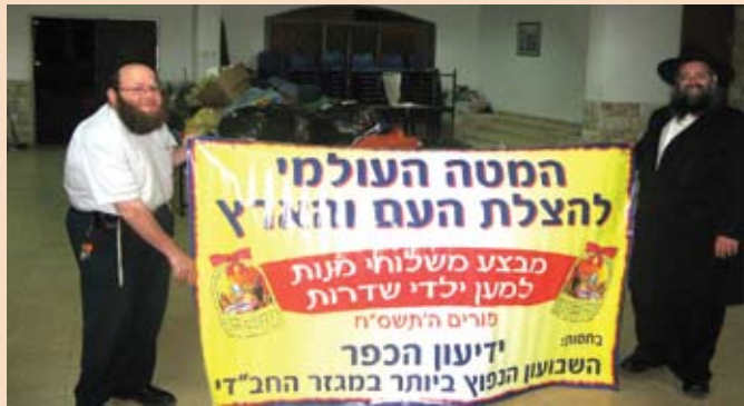
משלוחי המנות מגיעים לשדרות

החל מתחילת השבוע זרמו אלפי משלוחי מנות לשדרות ומגורשי גוש קטיף. רוב המשלוחים נרכשו אצל סוחרי שדרות, ואלפים נוספים נאספו מעשרות בתי ספר