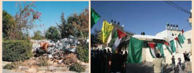
בית המחבל שטבח במרכז הרב עם דגלי האמם וחיזבלה • בית משפחת שומרון החרב בנוו דקלים

לקראת 60 שנות "עצמאותה" כביכול של המדינה, מתקשים השלטונות להחריב את ביתו של המחבל י"ש שטבח שמונת תלמידי ישיבת מרכז הרב בשערי עיר הבירה ירושלים. לעומת זאת שנתיים וחצי קודם לכן, מדינת ישראל, החל מהנשיא וכלה באחרון השוטרים, היו שותפים לפשע הנתעב של הרס וחורבן אלפי בתים בגוש קטיף וצפון השומרון, בזמן קצר מאד, תוך רמיסת זכויות יסוד של כבוד האדם וחירותו, ועד היום מופקרים מגורשי גוש קטיף על ידי המדינה.