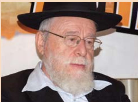
יו"ר רבני ארץ ישראל מן הרב דב ליאור שליט"א

איך אפשר לקבל אדם שפועל נגד תורתנו הקדושה וממשיך להוביל את עם ישראל לסכנות גדולות. איך אפשר לכבד אדם כזה? עד לרגע זה הוא לא הביע חרטה על מה שפעל וביצע נגד עם ישראל, ועדיין הם מתכננים את ה'התכנסות' כפי שהם קוראים לה. בינתיים נבצר ממנו לבצע את מזימתו בצורה אקטיבית, אבל הם חותרים לכך. לכן נהגו נכון שסרבו לקבל אישיות כזאת