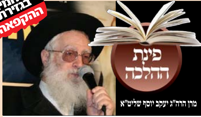
מרן הר"ה א"ג יעקב יוסף שליט"א