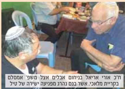
ח"כ אורי אריאל בניחום אבלים אצל משפ' אמסלם בקריית מלאכי, אשר בנם נהרג מפגיעה ישירה של טיל

"אנחנו חייבים מערכת מסודרת ומדדים מסודרים להגדרת פז"מ (פרק זמן מינימאלי) פיצויים מוסכם ומוגדר. התקנות קיימות אינן מטפלות בבסיס העניין, בשיטה. רק פז"מ פיצויים יחייב את הממשלה לתת מענה לאזרחים בזמן אמיתי. עבור הממשלה ואנשי רשות המיסים מדובר בזמן סביר, עבור תושבי הדרום זהו נצח. עלינו לצפות את העתיד ולא רק לחקור את העבר", דברי אריאל