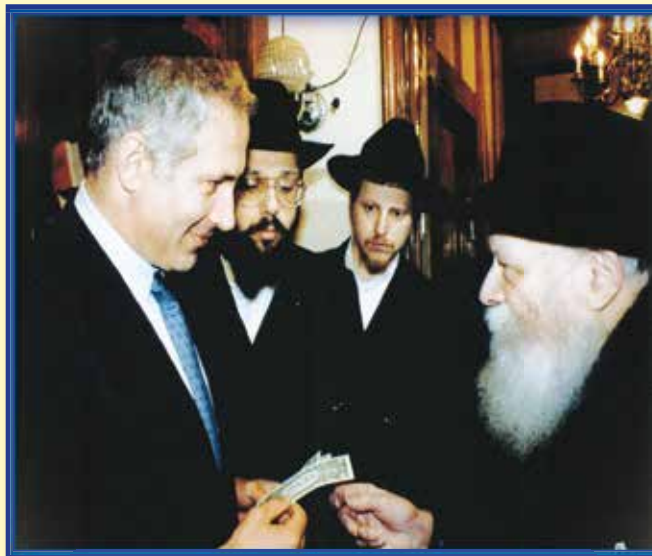
ראש הממשלה נתניהו מקבל את ברכת הרבי מליובאוויטש בקיץ 1991