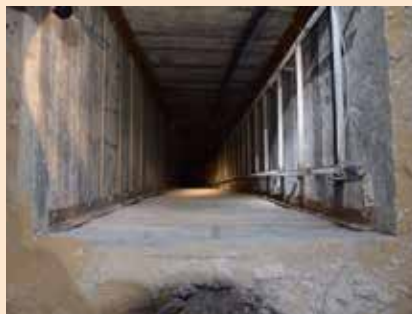
מנהרות מתחת לקיבוצי עוטף עזה

הגיע העת לאחזות. הגיע העת שקיבוצי עוטף עזה יפרסמו "קול קורא" ובו בקשת סליחה ומחילה מאנשי גוש קטיף היקרים, ששמרו על עם ישראל במשך 35 שנים, ספגו אלפי פצמ"רים בדומיה, ועצרו בגופם את הטילים והמנהרות. מודה ועוזב ירוחם!