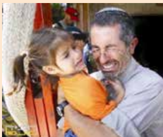
גירוש גוש קטיף 2005

חיים רמון: מה יש לנו לחפש בגוש קטיף? כן, מר רמון יש לנו לחפש הרבה בגוש קטיף: מנהרות, טילים, רקטות, רוצחי נשים וילדים ועוד ועוד. כן, מר רמון יש לנו לחפש שם גם את שרידי גופותיהם של לוחמי גולני.