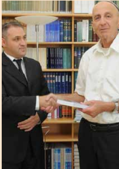
עו"ד קורינאלדי מעניק לשופט אדמונד לוי את הספר "משפט נעילה"

בחלוף מספר שנים וטרם פרישתו, נכנסתי לבקרו בלשכתו בבית המשפט העליון. הענקתי לו את ספרי והפלגנו בשיחה על הפרשה בפרספקטיבה. בדבריו ניכר היה שצערו ודמעותיו לא פסקו מלבו, והמשיכו ללוותו זמן רב בעקבות תוצאות חורבן גוש קטיף וכאבם של המתיישבים. יהי זכרו ברוך.